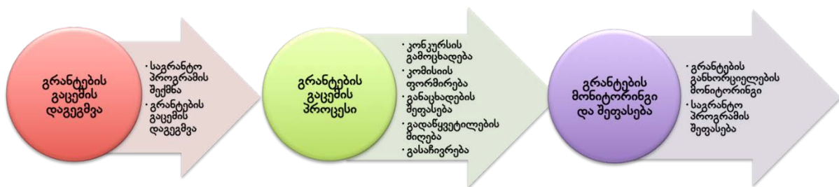
სურათი #1: სახელმწიფო გრანტების მართვის ციკლი

სახელმწიფო გრანტების მონიტორინგის პროცესი დაყოფილია სამ ძირითად ეტაპად, რომლებიც თავის მხრივ რამდენიმე ქვე-ეტაპად იყოფა (იხ. სურათი #1). მომდევნო თავებში, შეგიძლიათ დეტალურად იხილოთ თითოეული ეტაპის მონიტორინგის პროცესის აღწერა.