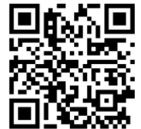
საზოგადოებრივი ტრანსპორტის პრობლემა ოზურგეთში - QR კოდი

ასევე, მერიის საბუღალტრო ცენტრს, სხვადასხვა დროს, სხვადასხვა ფორმით, საზოგადოებისა და ხელისუფლების წინაშე დაუყენებინა ქალაქ ოზურგეთში კანალიზაციის ქსელისა და გაშვებული ნაგებობის არარსებობის, ოზურგეთის მუნიციპალიტეტის სოფლებში წყალმომარაგებისა და ჩონჩხის მუნიციპალიტეტში ნარჩენების მართვის პრობლემები.