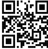
მიუსაფარი ცხოველების სტრატეგიის QR კოდი